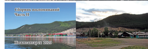
Сборник воспоминаний Часть II Нижнеангарск 2020